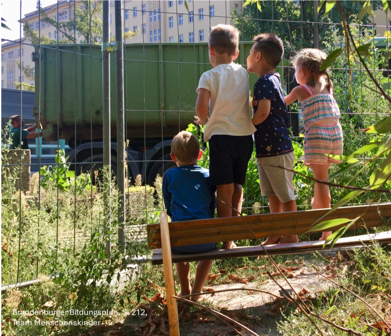
Brandenburger Bildungsplan, S. 212, Team MenschensKinder