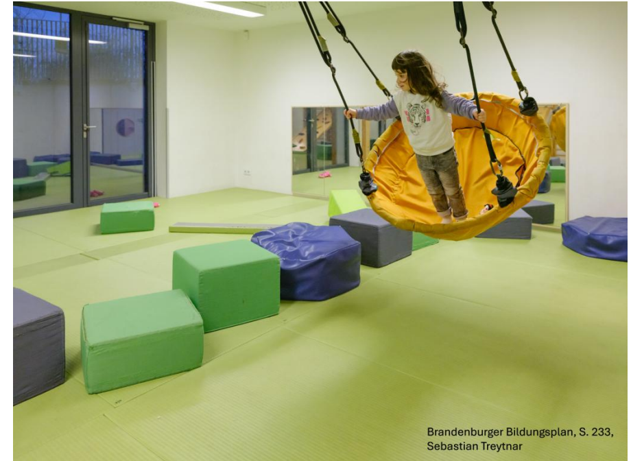
Brandenburger Bildungsplan, S. 233, Sebastian Treytnar