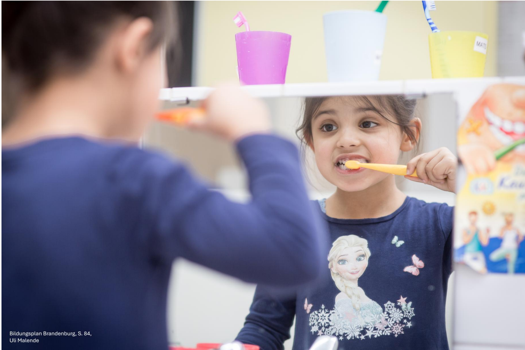
Bildungsplan Brandenburg, S. 84, Uli Malende